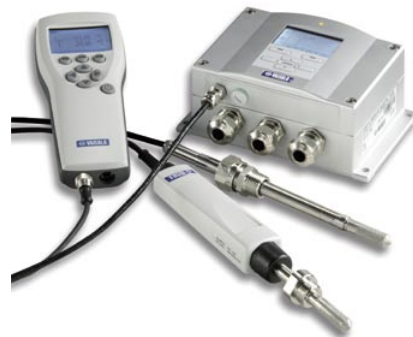
可有多种配置的维萨拉DMT340变送器及DM70手持表

为满足严格的特定安装要求而选择正确类型的露点传感器和变送器是一项非常重要的工作。由于考虑因素较多、可选择的方案及选项也较多,因此抉择过程中经常会出现令人困惑的情况,而且这个过程也比较耗费时间。本指南目的在于通过对一些您将面对的最基本问题的解答,对您在选择露点仪方面有一个方向性的指导。阅读完本指南,您应具有作出明智购买决定所必需的知识和方法。