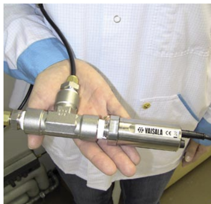
紧凑型DMT152可测量低至-80°C (-112°F)的露点

以上露点范围的划分可作为一般性准则,用于辅助指导产品的正确选择。比较好的区分低湿中湿两种测量技术路线的经验数值是-10°C(14°F)露点,因为这是低湿中湿露点范围的交叉点。然而由于有诸如压力、温度等应用条件的变化影响到该交叉点的阈值,因此在您做出最后决定之前最好能够向维萨拉的专家进行咨询。