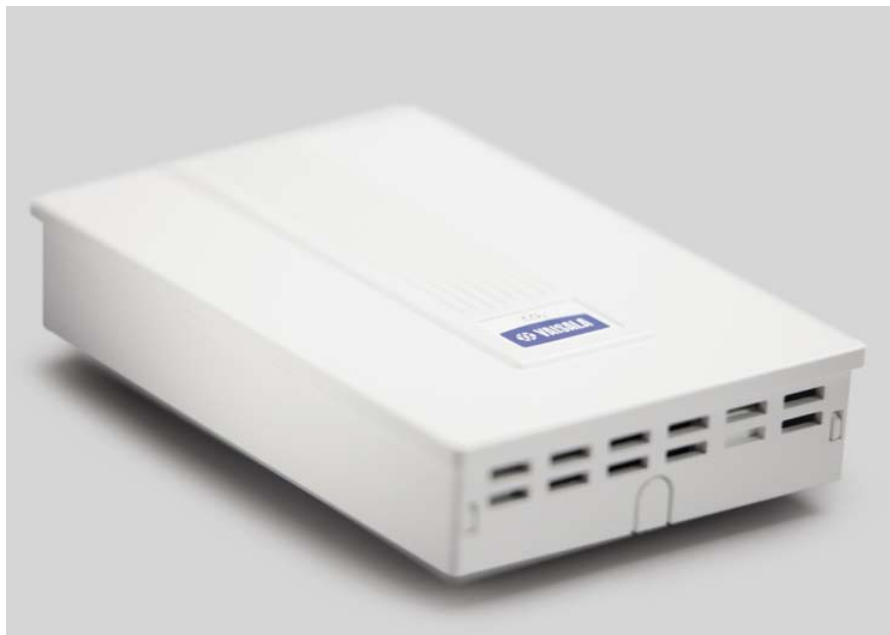
Vaisala CARBOCAP® koldioxidmätaren GMW115 är en väggmonterad CO 2 -mätare för behovstyrd ventilation.